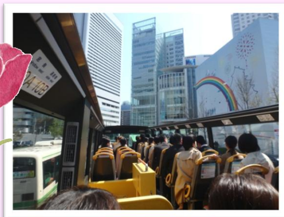
大阪市観光 バスツアー