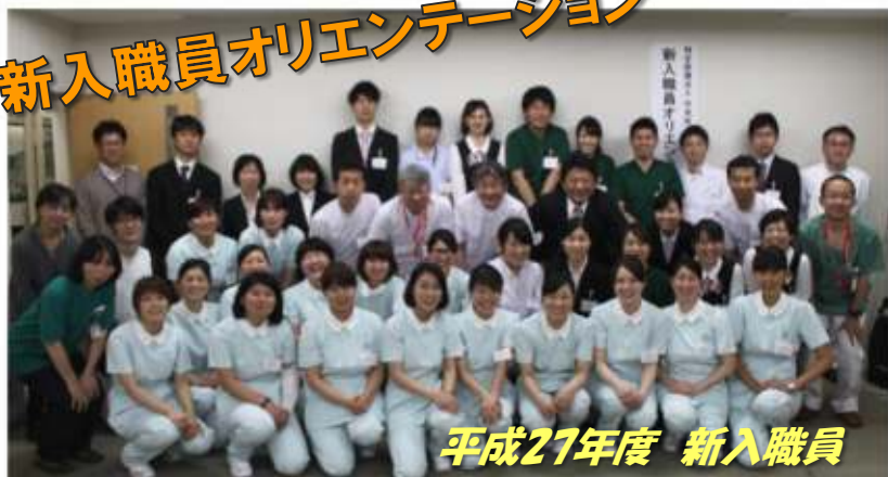
平成27年度 新入職員