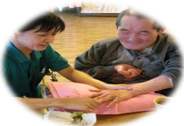
アロマケア (月・木・金)