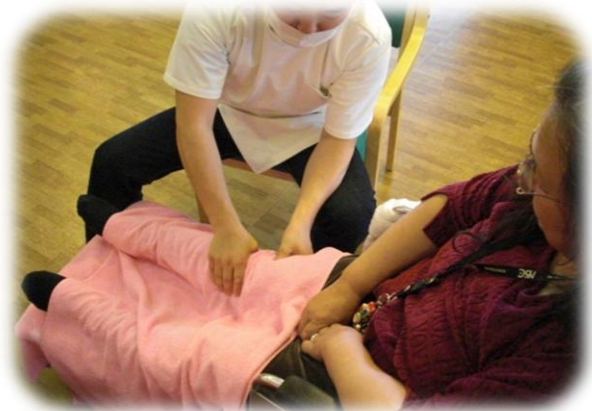
毎日！足つぼマッサージ