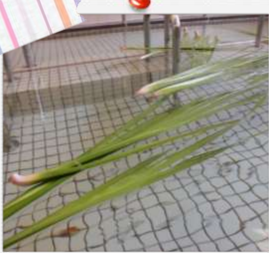
★★菖蒲湯を行いました★★ 5月5日(通所)

菖蒲湯(しょうぶゆ)とは5月5日の端午の節句の日に、ショウブ(菖蒲)の根や葉を入れて沸かす風呂のことである。年中行事のひとつ。 江戸時代、武家社会で菖蒲と尚武をかけた5月5日を尚武の節日として祝うようになったのが端午の節句の始まりだと言われ、その結果、今日でも5月5日には菖蒲湯に入る習慣が受け継がれているのだという。 【効果・効能】 ・血行促進・腰痛・神経痛・冷え性 ・筋肉痛・リウマチ